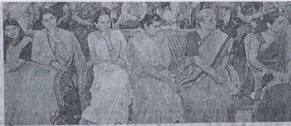
मंगलवार को हरिद्वार स्थित देवसंस्कृति विश्वविद्यालय के मृत्युंजय सभागार में अखंड दीपक शताब्दी समारोह के अंतर्गत आयोजित सम्मेलन में उपस्थित कार्यकर्ता। सम्मेलन को संबोधित करते राज्यपाल लेफ्टिनेंट जनरल गुरमीत सिंह (सेनि)

देवसंस्कृति विश्वविद्यालय के मृत्युंजय सभागार में अखंड दीपक शताब्दी समारोह के अंतर्गत आयोजित सक्रिय कार्यकर्ता सम्मेलन में बतौर मुख्य अतिथि गायत्री स्वजन को संबोधित करते हुए राज्यपाल ने कहा कि आने वाले समय में भारत विश्व गुरु बनकर उभरेगा और पूरे विश्व का मार्गदर्शन करेगा।